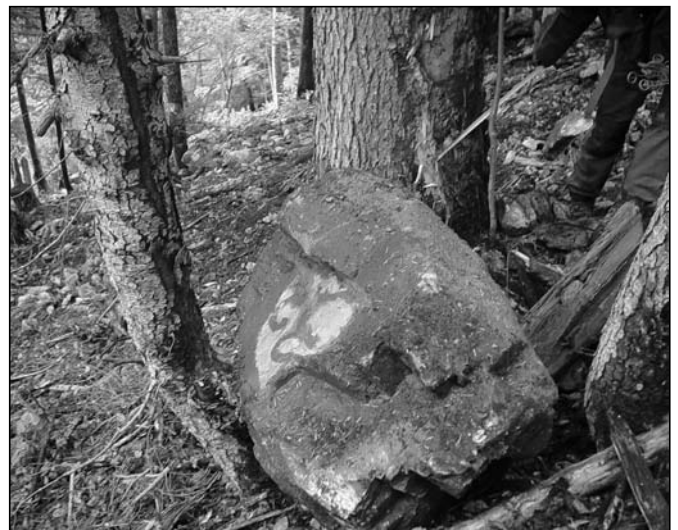
Abb. 1: Nach mehreren Baumkontakten kam der Felsblock mit der Versuchsnummer 33 im Testgebiet Vaujany vor einer dünnen Tanne zum stehen.